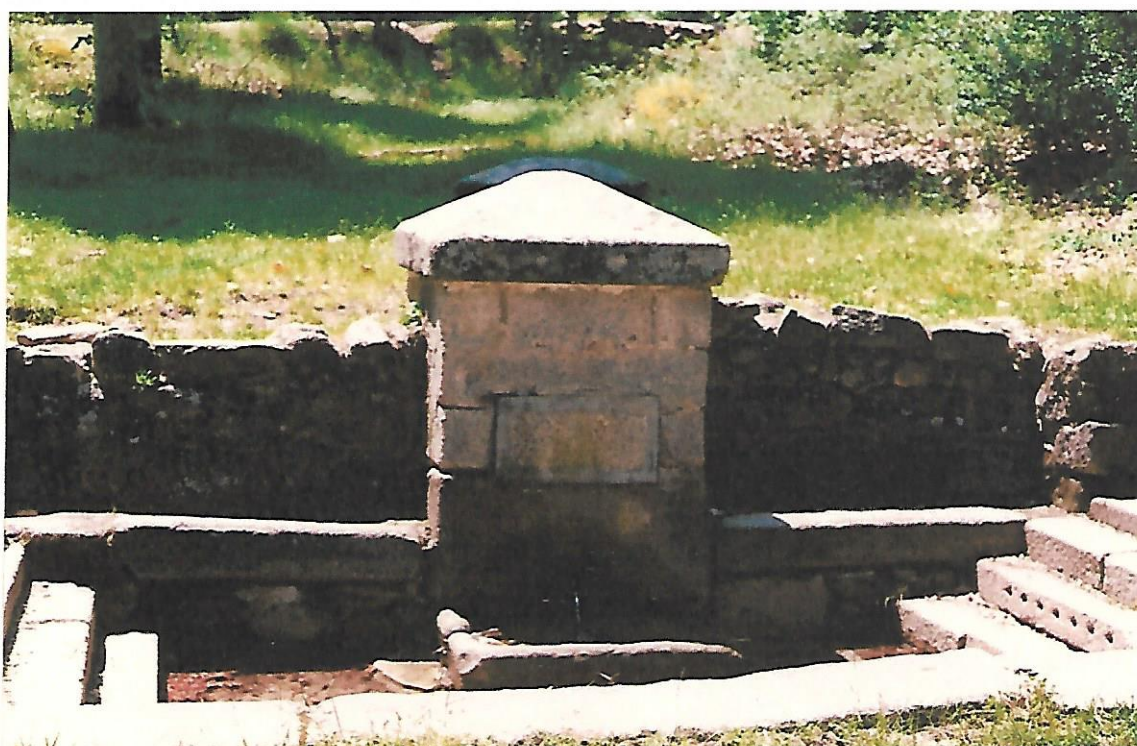
Fuente de las Arenitas

Denominada de esta manera, por crecer poco la hierba en este lugar, debido, posiblemente, a que las raíces de los árboles, alrededor de la misma, absorben prácticamente toda la humedad, acumulándose más bien: tierra y arena, y también, por estar un poco hundida en la tierra.