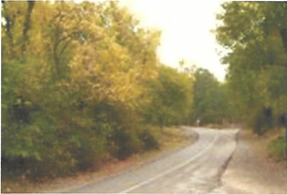
Carretera de la Silla

Proseguimos nuestro paseo por la Carretera de La Silla.