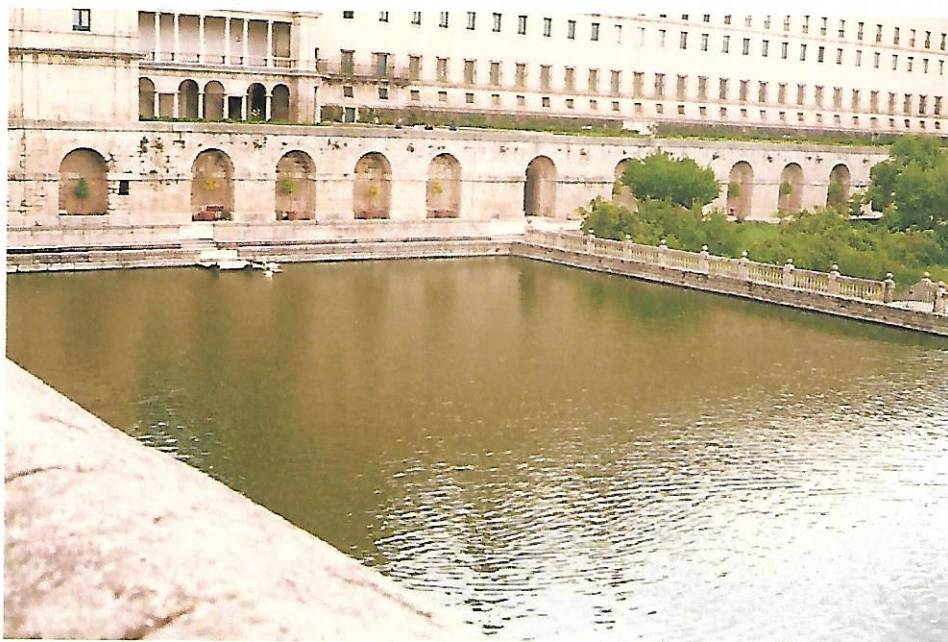
Galería de Convalecientes, Estanque y Jardines de la cara Sur