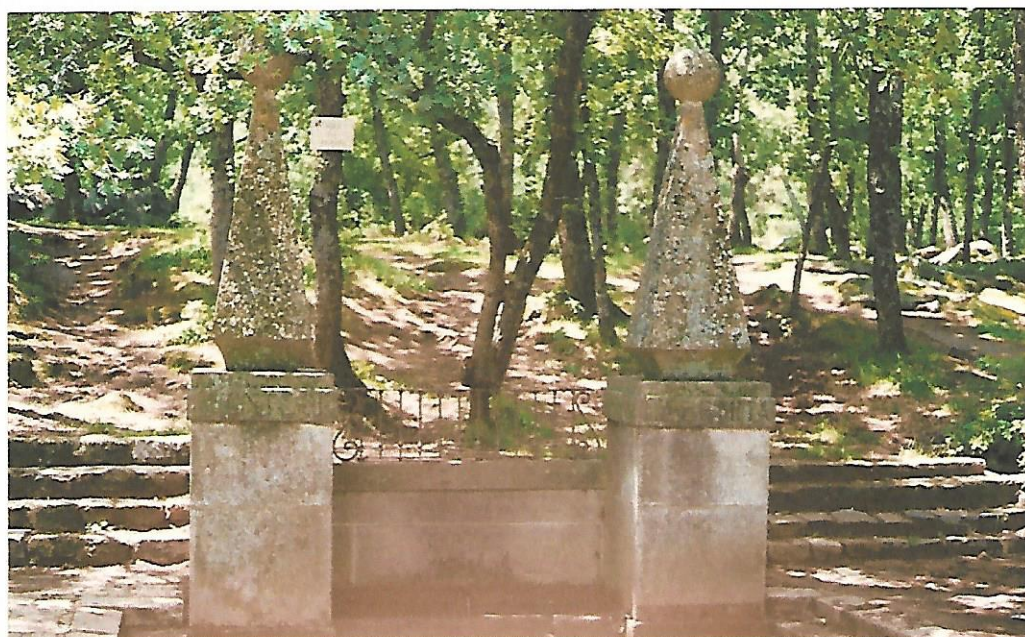
Fuente de la Ermita