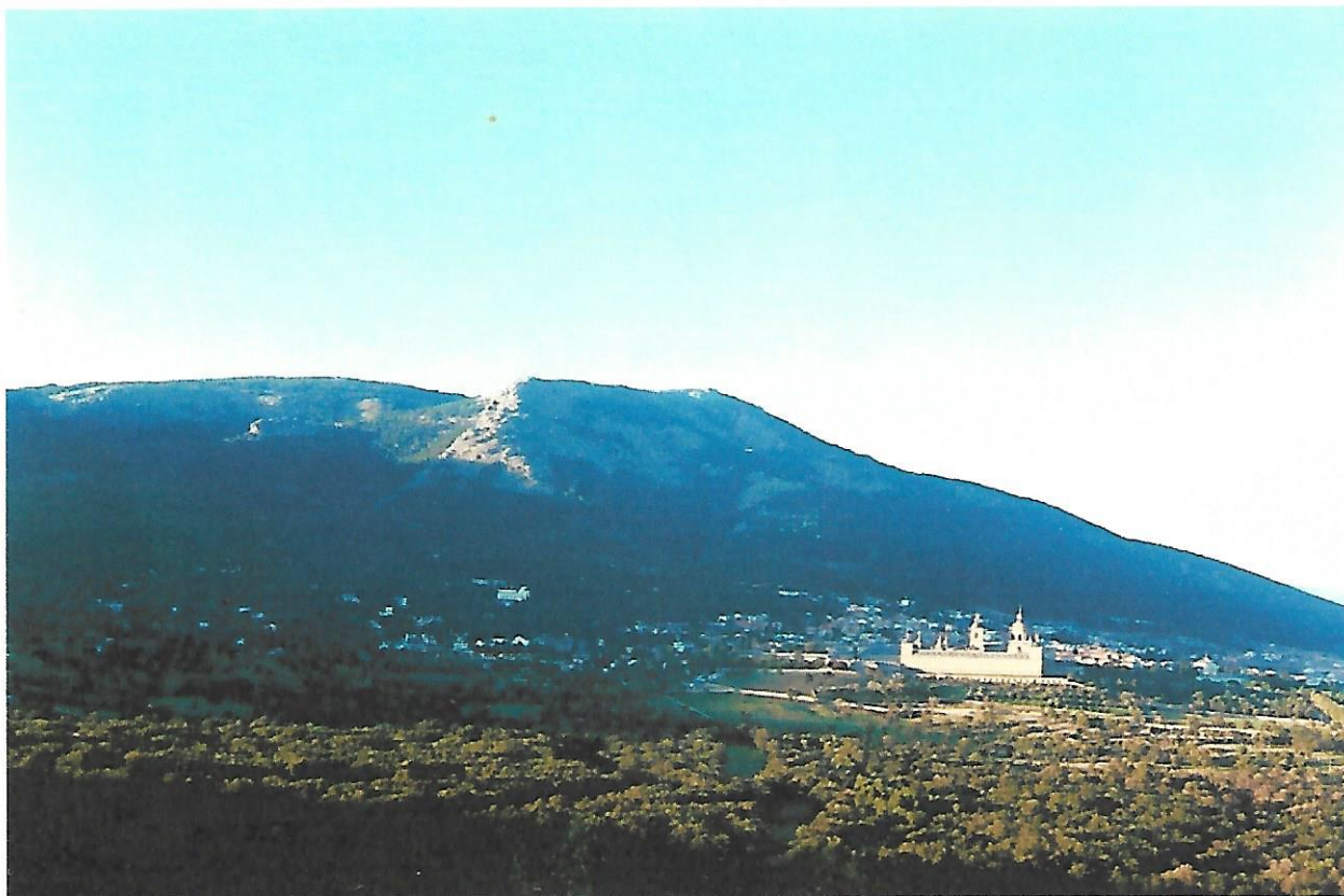
Vista parcial del Circo montañoso que rodea San Lorenzo de El Escorial y Vista del propio Monasterio, desde La Silla de Felipe II

La Silla de Felipe II esta enclavada en la falda de los montes, conocidos con el nombre de los Ermitaños, en el corazón de la Herrería.