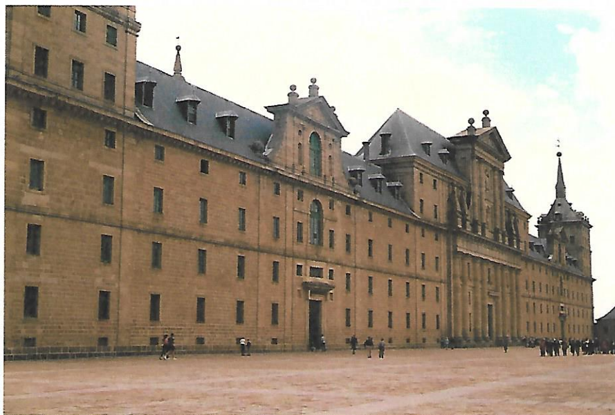
Fachada Principal o de Poniente del Real Monasterio

Giramos a la izquierda, y nos situamos frente a la fachada Oeste del Monasterio, donde se ubican: La Puerta del Real Colegio Alfonso XII, La Entrada Principal a la Basílica del Real Monasterio de San Lorenzo de El Escorial, que está orientada hacia PONIENTE, y La Entrada al Convento de los Padres Agustinos, que desde 1885, rigen este Monasterio.