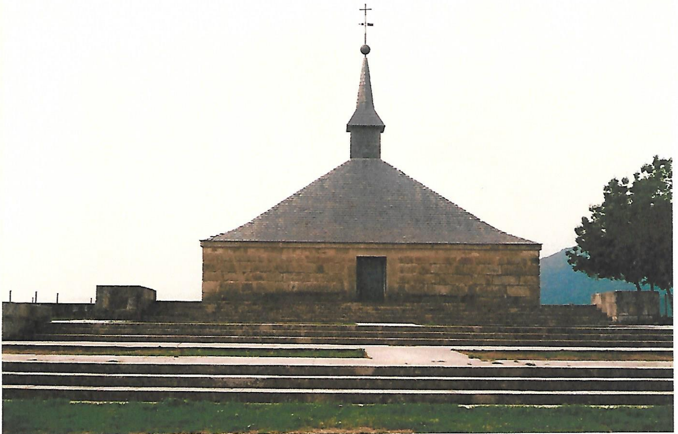
Pozo de la Nieve

La utilidad de esta nieve, entre otros usos, era el poder mantener congelados los alimentos, de forma natural, tanto para el Convento y Monasterio como para La Corte.