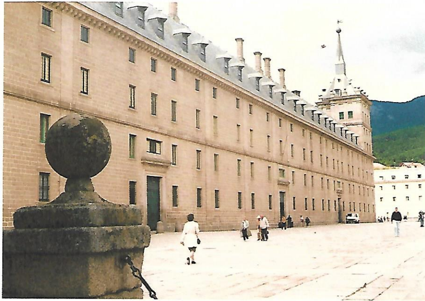
Lonja y Fachada Norte del Monasterio

Continuamos con nuestro itinerario, y nos adentramos en la Lonja, por la fachada NORTE del Monasterio. Allí observamos, por este orden: La Puerta de Carruajes, La Puerta de Palacio y la Puerta de Cocinas.