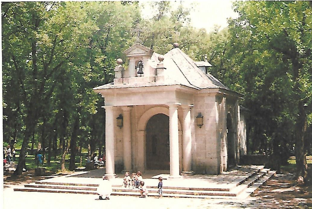
Ermita de la Virgen de Gracia

La razón por la que La Ermita fue trasladada a este nuevo lugar, se debió a lo lejos que quedaba su primera ubicación.