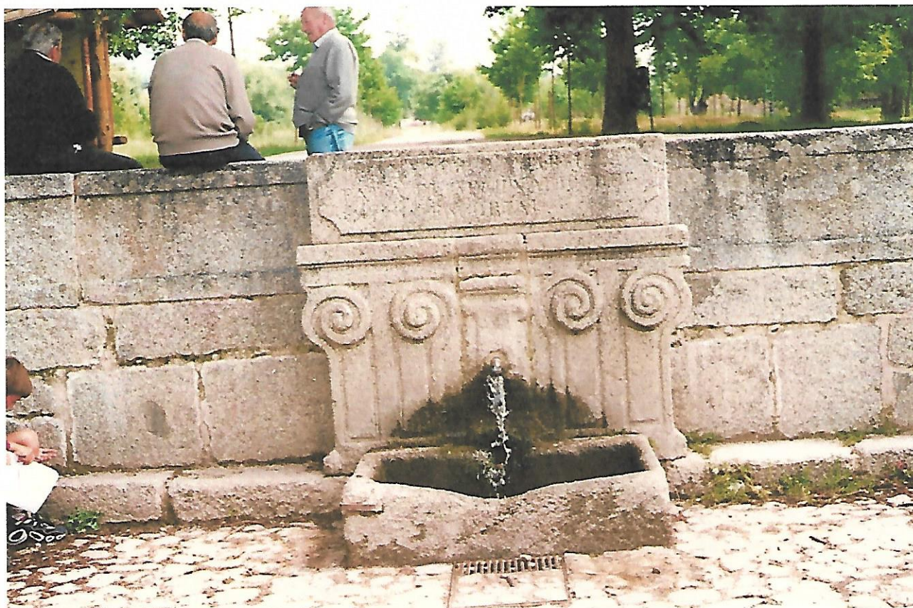
Fuente del Seminario

Junto a la Fuente del Seminario, podemos observar una mesa redonda de piedra de granito, cuyo origen es una rueda de molino.