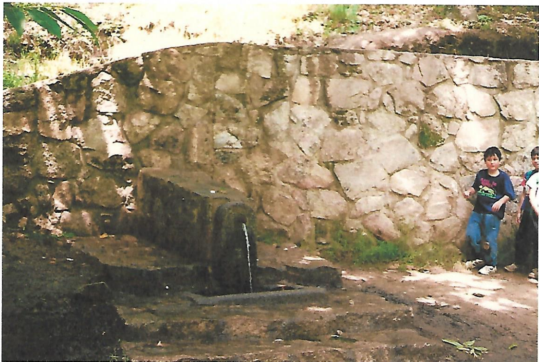
Fuente de la Reina

Esta Fuente es muy caudalosa y de agua muy fina. Alrededor de la misma, hay una serie de pequeños manantiales, normalmente escondidos, por la gran cantidad de vegetación, y adornados con castaños muy longevos.