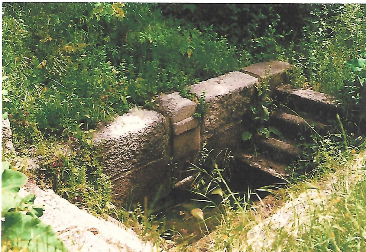
Fuente de los Capones

Era bastante caudalosa, y según la tradición popular, a ella se acercaban, en primavera, los maestros de San Lorenzo, con sus alumnos más jóvenes, de ahí el nombre de la Fuente, para dar clases en plena naturaleza, siendo el sitio idóneo para ello.