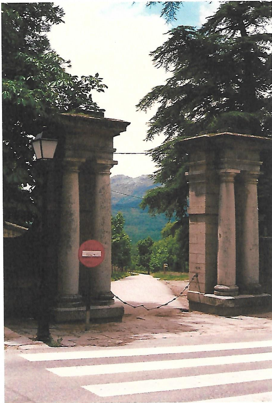
Entrada a la Herrería

En la actualidad, Patrimonio Nacional se encarga de su custodia y conservación.