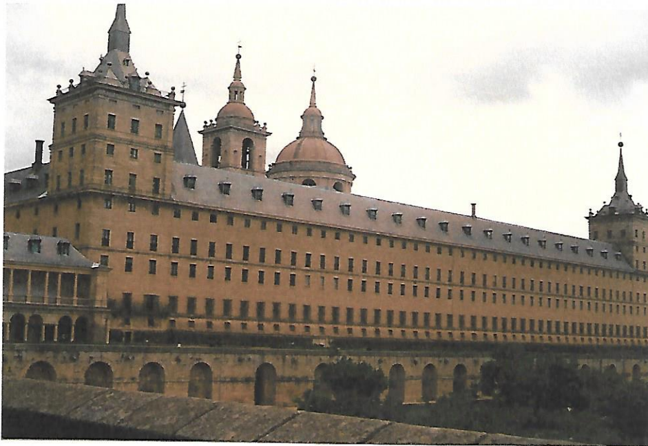
Fachada Sur del Monasterio

Desde ese lugar, podemos observar: LA GALERÍA DE CONVALECIENTES, LOS JARDINES Y EL ESTANQUE. El agua almacenada, era utilizada para regar la Huerta del Monasterio. Actualmente, podemos encontrar peces de colores, carpas de gran tamaño y algunos patos.