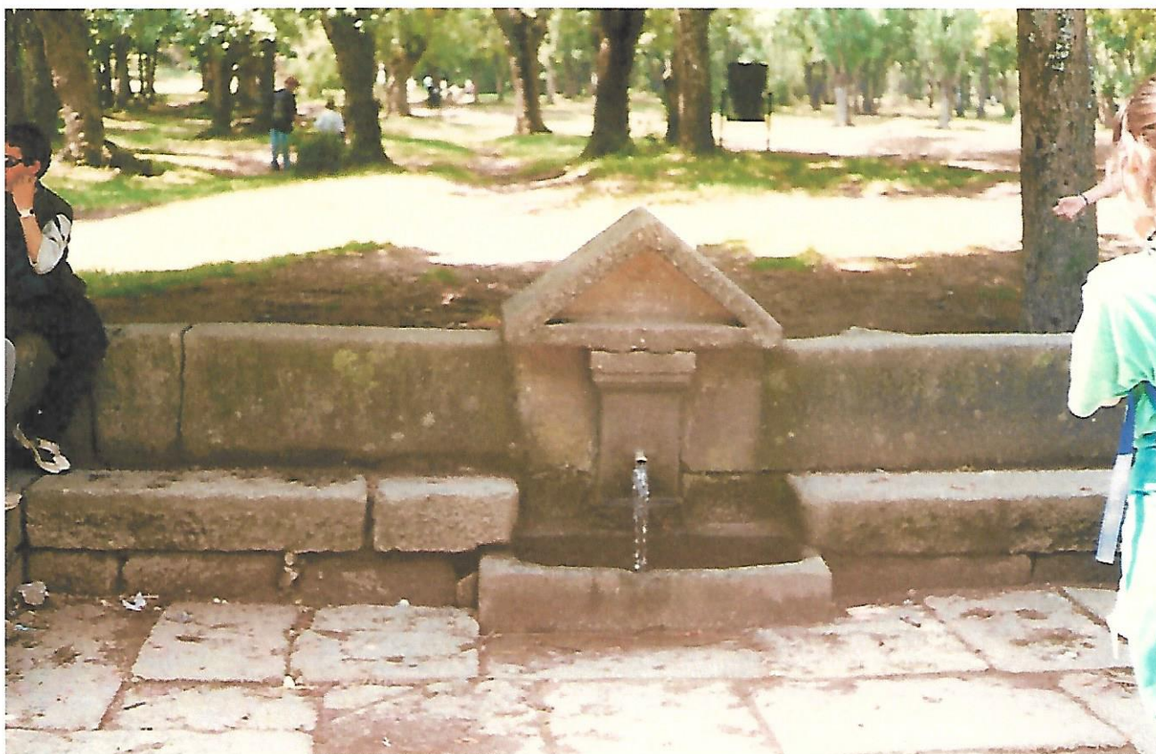
Fuente de la Prosperidad

Esta Fuente fue construida en 1892 y era lugar de Reunión de los canteros, antes y después de su cotidiana y ardua tarea, pues toda esta zona estaba rodeada de canteras.